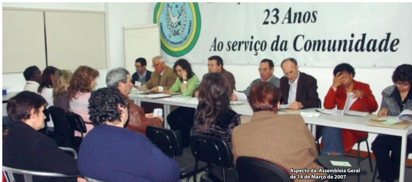
Aspecto da Assembleia Geral de 14 de Março de 2007

Foram aprovados, no passado dia 14 de Março, por unanimidade, o relatório e contas do exercício de 2006 da Associação de Moradores das Lameiras, com balanço positivo, quer nas actividades realizadas quer nas contas do exercício, que pela primeira vez ultrapassaram um milhão e meio de euros. A Dívida com banca foi reduzida de 220 para 190 mil euros. Este é o resultado da gestão de dois complexos: o Edifício das Lameiras com 290 casas e 1500 residentes e o Centro Social e Comunitário com 385 utentes nas diferentes valências. A AML dispõe de um quadro de pessoal qualificado com 72 trabalhadores e várias dezenas de voluntários.