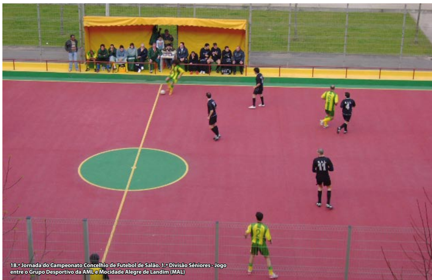
18.ª Jornada do Campeonato Concelhio de Futebol de Salão. 1.ª Divisão Sêniores - Jogo entre o Grupo Desportivo da AML e Mocidade Alegre de Landim (MAL)

Têm prosseguido a bom ritmo, os Campeonatos Concelhios de Futebol de Salão nos escalões de Sêniores da 1.ª Divisão, Juvenis e Iniciados. Neste último trimestre verificaram-se alguns pequenos incidentes com adeptos da Carreira e de Castelões que prejudicaram, consideravelmente, as equipas de sêniores e infantis desta Associação. Por sua vez, alguns árbitros, que deveriam dar o exemplo de isenção e honestidade, deixam transparecer nos relatórios que elaboram, contradições anormais pondo em causa a verdade dos acontecimentos. Quem tem medo da verdade não deve enveredar pela carreira de árbitro! Sempre defendemos que o desporto é um dos melhores meios para o aproveitamento e ocupação dos tempos livres dos jovens, funcionando como terapia para combater a violência, a toxicod dependência, o racismo e a delinquência juvenil. Pelo desporto é possível criar plataformas de convergência que interajam e provoquem convivências sadias entre pessoas de diferentes lugares, raças e etnias. Perder ou ganhar é desporto, desde que não haja terceiros a tentarem criar resultados fictícios. Nestes campeonatos de aldeia, existem possibilidades reais de dar lições de sabedo-