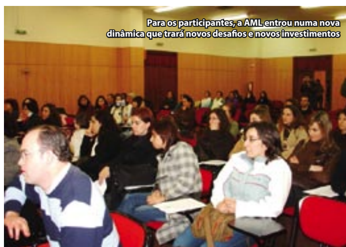
Para os participantes, a AML entrou numa nova dinâmica que trará novos desafios e novos investimentos