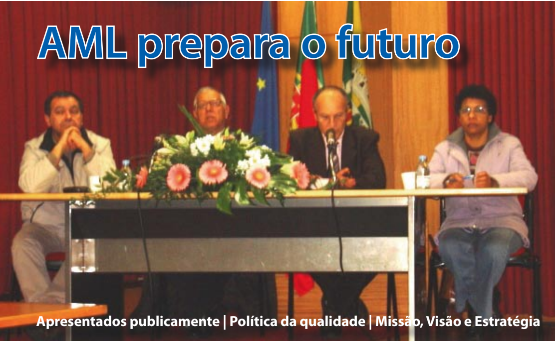
Apresentados publicamente | Política da qualidade | Missão, Visão e Estratégia

No passado dia 15 de Fevereiro, no Auditório da Biblioteca Municipal, a Direcção da Associação de Moradores das Lameiras, apresentou publicamente sua política da qualidade e a Missão, Visão e Estratégia, relativamente ao futuro.