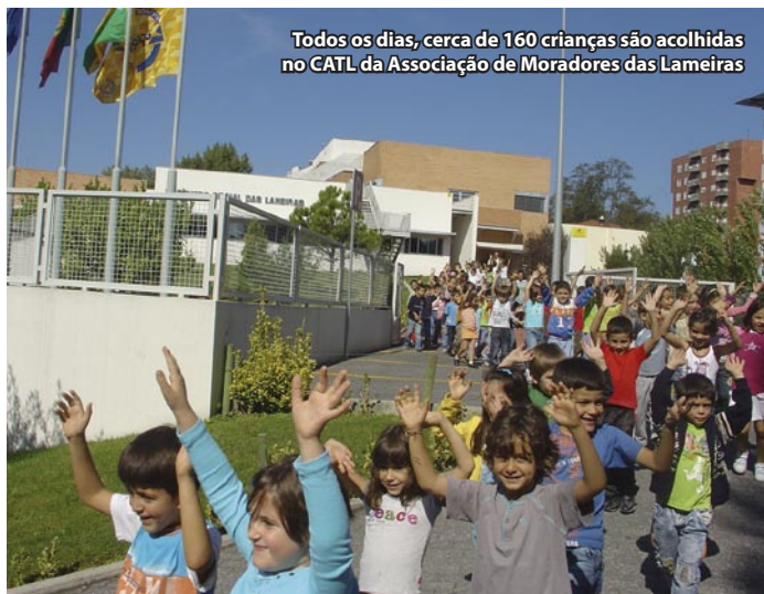
Todos os dias, cerca de 160 crianças são acolhidas no CATL da Associação de Moradores das Lameiras