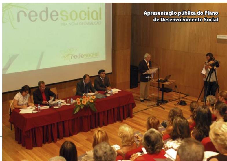
Apresentação pública do Plano de Desenvolvimento Social

pretendemos fornecer uma informação actualizada de diagnósticos, planos e acções, a realizar entre 2007 e 2015. É um projecto dinâmico e interactivo, nomeadamente através da Internet, no sítio oficial do Município, onde estarão sempre disponíveis novos conteúdos". Um dos capítulos mais importantes do Plano Social é o diagnóstico prospectivo, um trabalho que aponta, pela primeira vez, os pontos fortes estratégicos, capazes de posicionar o concelho, num patamar de excelência. Neste âmbito, o Plano Social aponta a saúde escolar, a aprendizagem ao longo da vida, a rede social, a qualidade nos serviços e o atendimento e acompanhamento social, como áreas de excelência no desenvolvimento social do concelho.