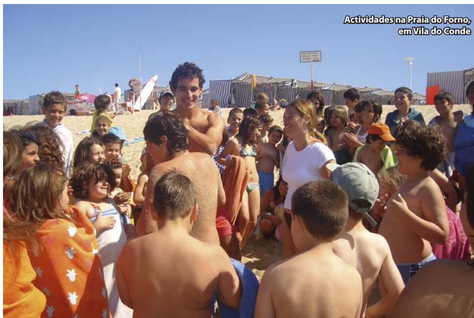
Actividades na Praia do Forno, em Vila do Conde

Os jovens e adolescentes procuram descobrir novos percursos de aventura, preservar o meio ambiente, conviver em grupo, colaborar e interagir com os mais idosos, participando em actividades intergeracionais. A promoção dos direitos