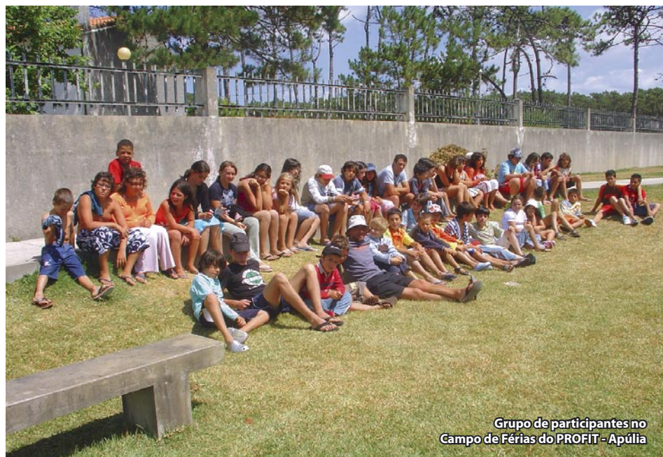
Grupo de participantes no Campo de Férias do PROFIT - Apúlia

O PROFIT – Projecto de Vila Nova de Famalicão para a integração Territorial, de que a Associação de Moradores das Lameiras é parceira, com mais duas dezenas de organizações e instituições de todo o Concelho, organizou, na Apúlia, entre 20 e 24 de Agosto, um campo de férias com o título: “Um traço de mim”, para crianças e jovens oriundas das famílias mais humildes. Do Complexo Habitacional das Lameiras participaram 45 crianças e jovens, tendo a AML disponibilizado dois técnicos para acompanhar as diversas actividades realizadas na praia, no campo e no museu de Fão. Uma forma diferente de interagir com outras realidades e criar novas amizades entre a gente jovem. Parabéns ao PROFIT por esta iniciativa.