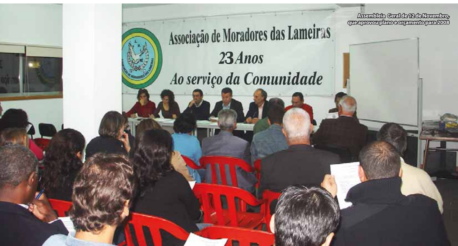
Assembleia Geral de 12 de Novembro, que aprovou plano e orçamento para 2008