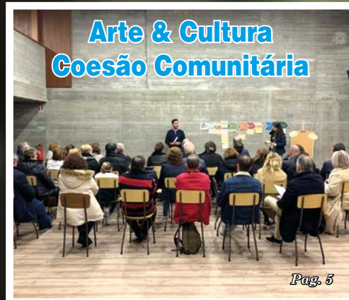
Arte & Cultura Coesão Comunitária