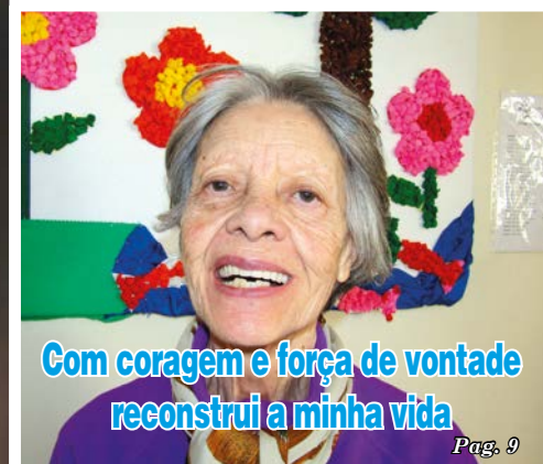
Com coragem e força de vontade reconstrui a minha vida